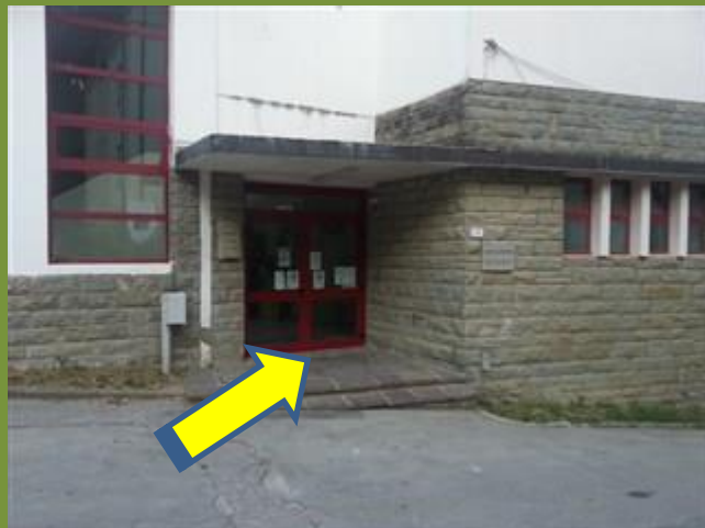
Porta principale classi 2-3

Orario Provvisorio dalle ore 8:20 alle ore 12:30