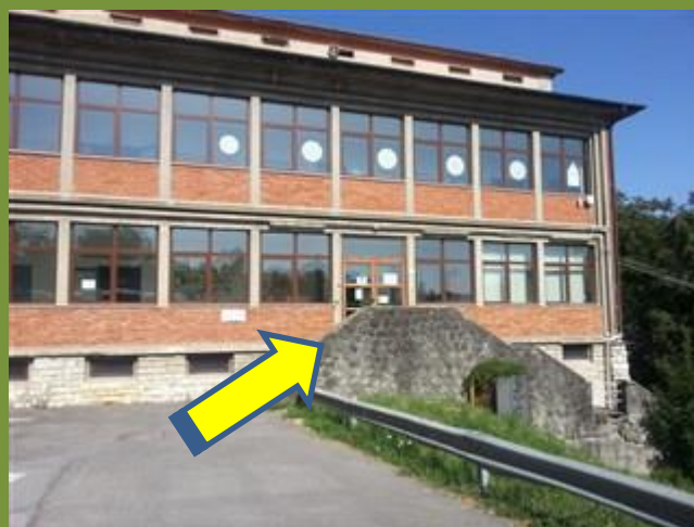
Porta emergenza lato Ovest c/o Scuola Secondaria I grado « Renato Fucini » Classe 5