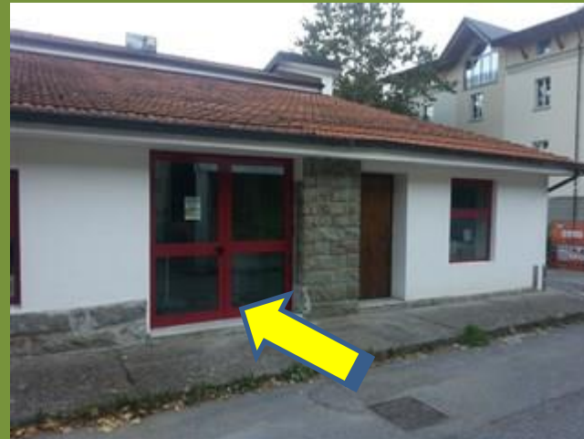
Porta emergenza lato Nord classe 1-4 + Alunni su pulmino