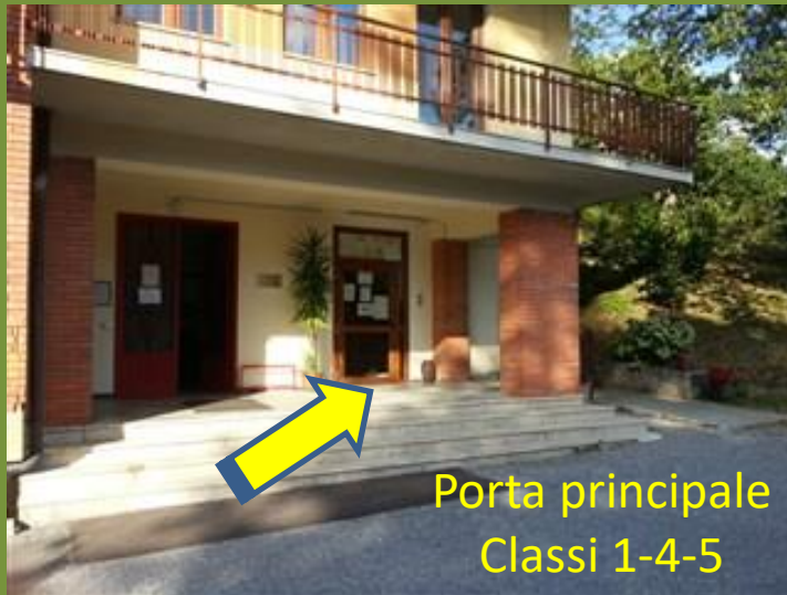
Porta principale Classi 1-4-5

Orario Provvisorio dalle ore 8:20 alle ore 12:45