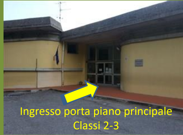
Ingresso porta piano principale Classi 2-3

Orario Provvisorio dalle ore 8:20 alle ore 12:45