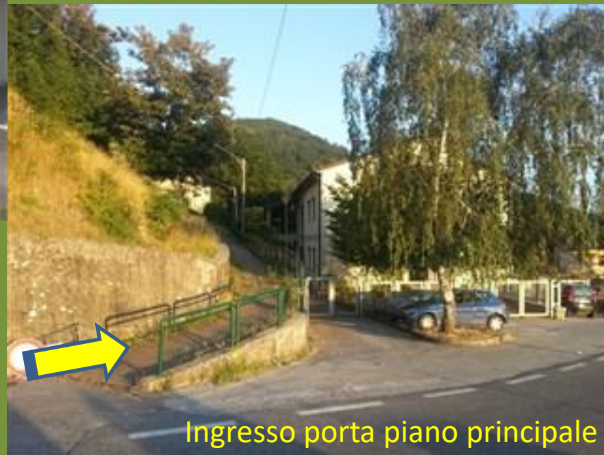
Ingresso porta piano principale

Orario Provvisorio dalle ore 8:30 alle ore 12:30