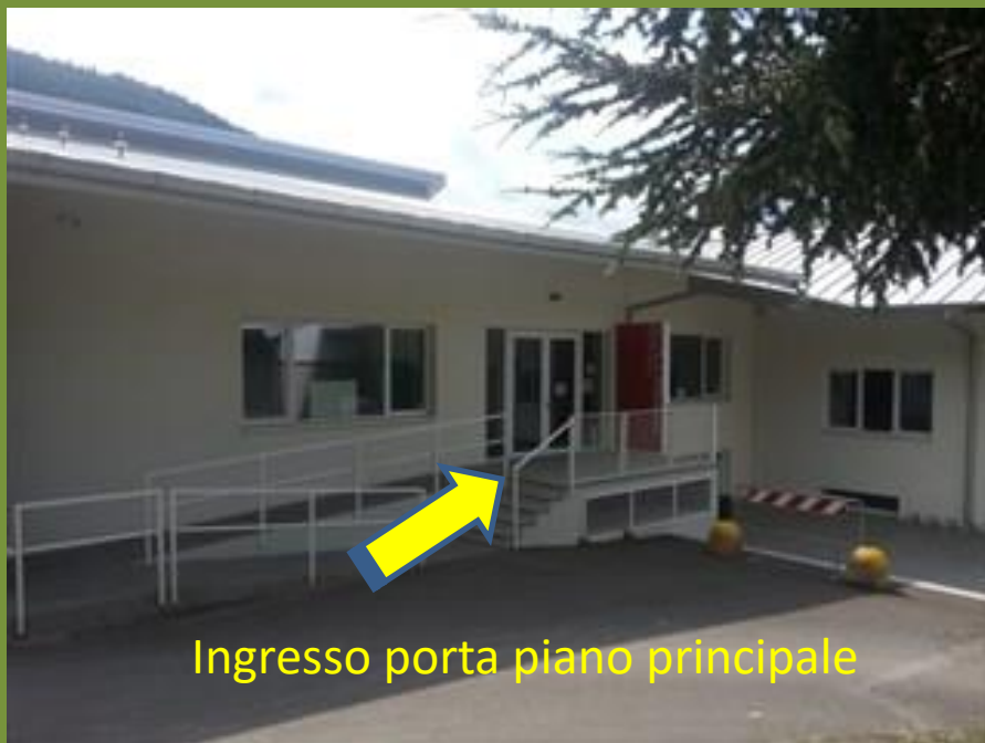
Ingresso porta piano principale